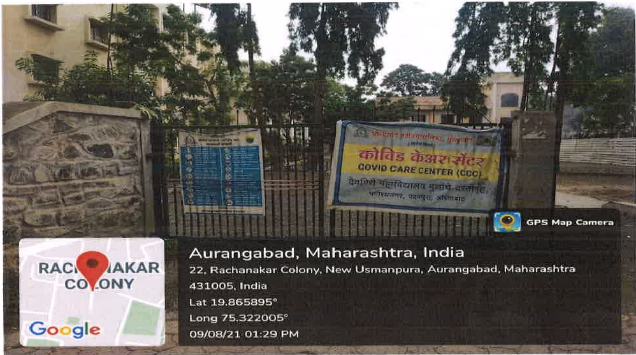
Photograph: Deogiri College Boys Hostel Covid Care Center