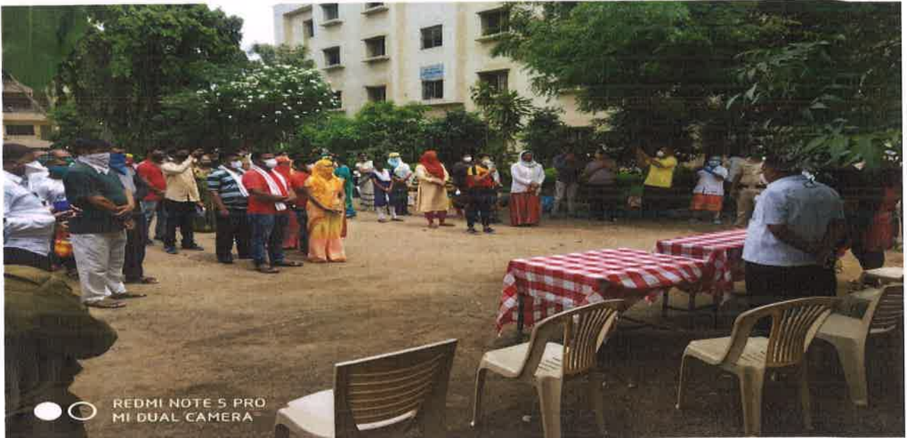
On the occasion of offering discharge to the covid patients.